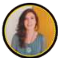
BETSABÉ NAVARRO @betsabenr